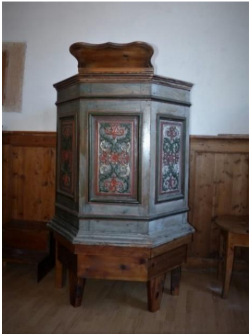
Chaire portative de Saint Véran

Pour adapter l'emplacement de la chaire à l'importance de l'assistance qui peut entraîner des modifications des règles d'acoustique, certains temples ont mis en place des chaires mobiles. C'est le cas le cas à Saint-Véran. A la chapelle luthérienne de l'Ambassade de Suède à Paris, la chaire était montée sur roulettes.