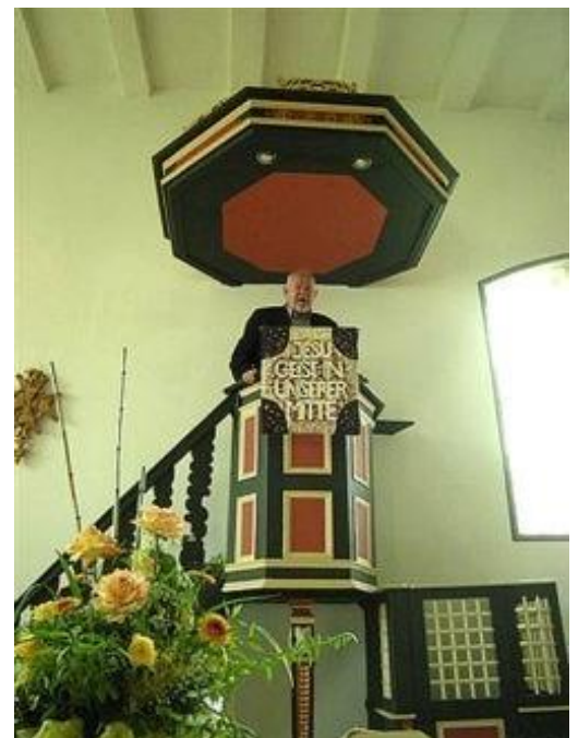
Chaire huguenote de Hesse Cassel