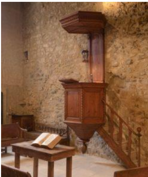
Chaire du temple de Poët Laval