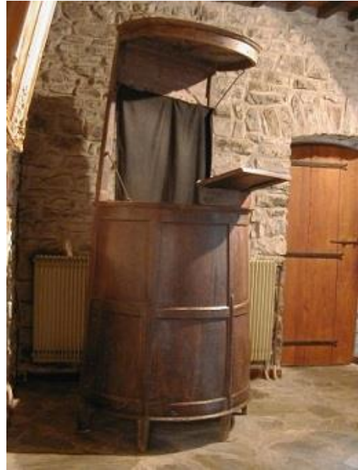
Chaire de Lédignan, noyer et châtaignier, en forme de tonneau à grain, plafond et pupitre emboîtables.

Pour ne pas se faire remarquer par les soldats du roi, les Dragons, les protestants avaient recours à différentes astuces comme cette chaire escamotable en forme de tonneau ou les chaires démontables apportées, pour l'occasion, pour des assemblées au « désert » dans des lieux cachés (bois, grottes etc.)