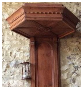
...et son sablier